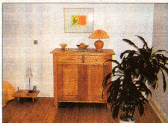
Ikke en eneste nullermand gemmer sig i hjørnerne i det spirituelle bofællesskab. Rengøring er nemlig en vigtig del af terapien på stedet.