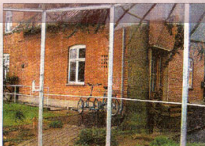
Usynlig mur: Beboerne i sekten har meldt sig helt ud af samfundet, og kun få forlader det idylliske landsted for at tage på arbejde.