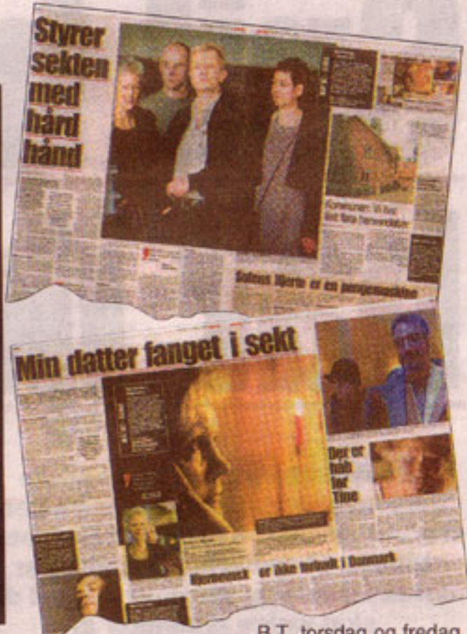
B.T. torsdag og fredag